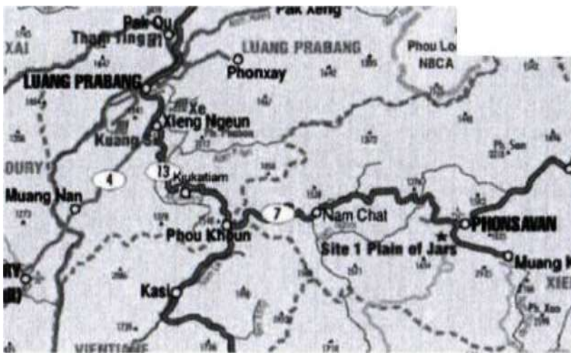
Nrog cim kom zoo: Cov caij ciam xeev qhia hauv daim ntau theej teb no nws tsis thooj xws li muai nyob xyoo 1960.

Tsis ntev tom qab uas tawm tom lub zos los, nkawd ob tug cia li los ntsib ib pab neeg sawv rog. Puas yog lawv los nkaum tos nkawd kev, los sis puas yog nkawd raug dag? Cov lus nug tseem teb tsis tau los txog niaj hnuv nim no. Li cas los yuav tsum nrhiav nug lawv, raws li xav puas yog tim Xyooj lub npe nrog rau ob tug Hmoob koj ke sib koom siab thiaj muaj kev sib ntsib phem zaum no. Tab sis ua ntej tshaj plaws yuav tau xyuas txog txhua yam uas xub ua los tso, raws li txhua yam uas tau muab xo ntawm cov tim khawv uas muaj feem xyuam nrog thiab cov tau hnov los sib sau xyuas ua ke, uas yog los ntawm cov qub tub rog lawv tus kheej sawv tawm tsam, tias zaj xwm no tseem rov hnov tshwm ntau caum xyoo tom qab no ntxiv. Tus hau zos Phuaj Xuab thiab nws cov thawj leg num, yeej tsuas hais tas zog tias tom qab nkawd sawv kev lawm peb yeej tsis hnov suab sab dab tsi txog peb ob tug qhua ntawd kiag li.